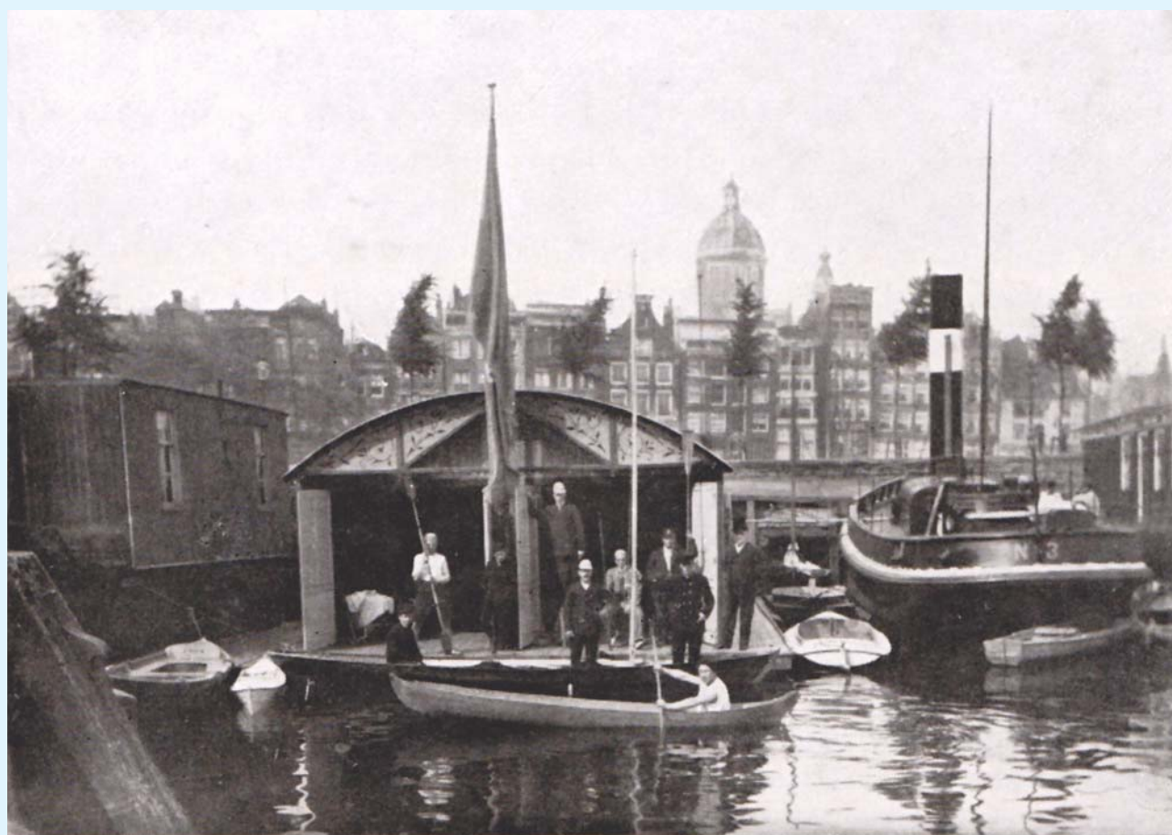
1891: Botenhuis in het Oosterdok.

Giften en donaties zullen vermeld worden op een sponsorplaque in de nieuwbouw.